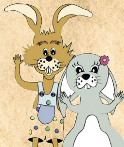
Waldi & Bella